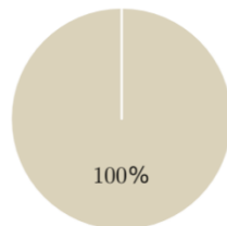
1. Taxonomie-Ausrichtung von Investitionen einschließlich Staatsanleihen*

■ Taxonomiekonform ■ Andere Investitionen